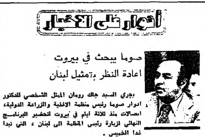
صوما يبحث في بيروت إعادة النظر بتمثيل لبنان

بحري السيد جاك رومان الممثل الشخصي للدكتور ادوار صوما رئيس منظمة الإنفخية والزراعة الدولية، اصلاحت منذ ثلاثة ايام في بيروت تحضير البرنامج النهائي لزيارة رئيس الحكومة الى لبنان، التي تبدأ غدا الخميس. ويقول السيد رومان ان البحث بتبديل لبنان في المنظمة سيكون على جدول أعمال الزيارة، الى جانب عدة موضوعات تتعلق بالمساعدات المقررة للبنان في مرحلة ما بعد الحرب.